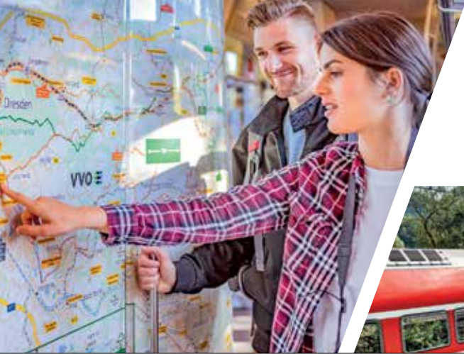
Unterwegs im ZVVO

Der Verkehrsverbund Oberelbe (VVO) und der Zweckverband Verkehrsverbund Oberlausitz-Niederschlesien (ZVVO) zusammengeschlossen. Bis zum Start eines neuen gemeinsamen Ostsachsentarifs bleiben die beiden regionalen Tarife bestehen, zu denen wir hier alle wichtigen Informationen zusammenfassen. www.zvvo.de