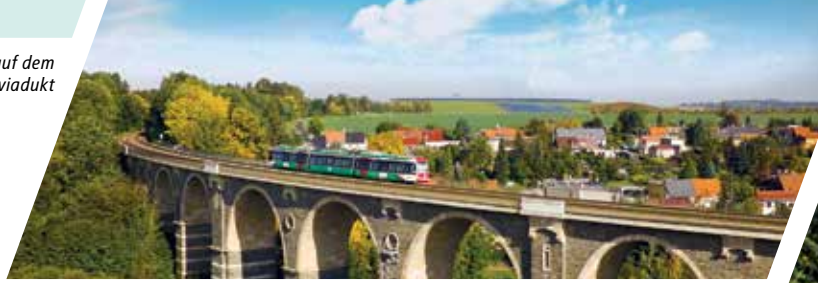
Citylink auf dem Bahrebachmühlenviadukt