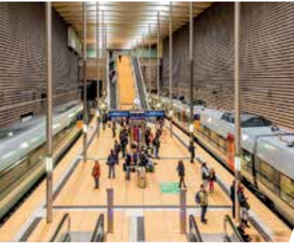
Citytunnel Leipzig Station Markt

Weitere Informationen erhalten Sie bei den Verkehrsunternehmen und -verbünden.