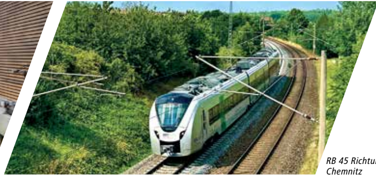
RB 45 Richtung Chemnitz