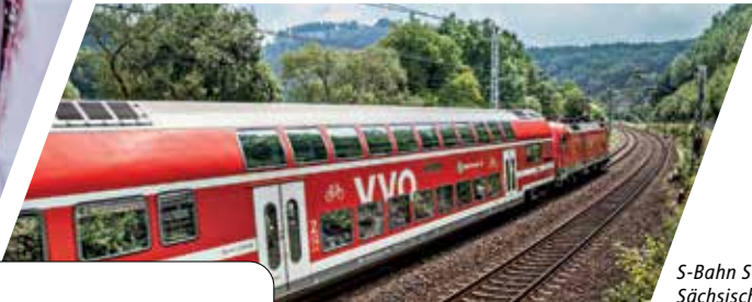
S-Bahn S 1 in der Sächsischen Schweiz