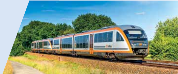
1 RE 2 in Arnsdorf auf dem Weg nach Liberec 2 trilex-Desira unterwegs 3 RB 64 in Hoyerswerda