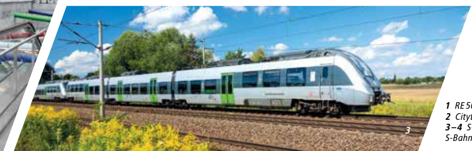
1 RE 50 in Leipzig Hbf 2 Citytunnel Leipzig 3-4 S-Bahn im Mitteldeutschen S-Bahn-Netz (MDSB)